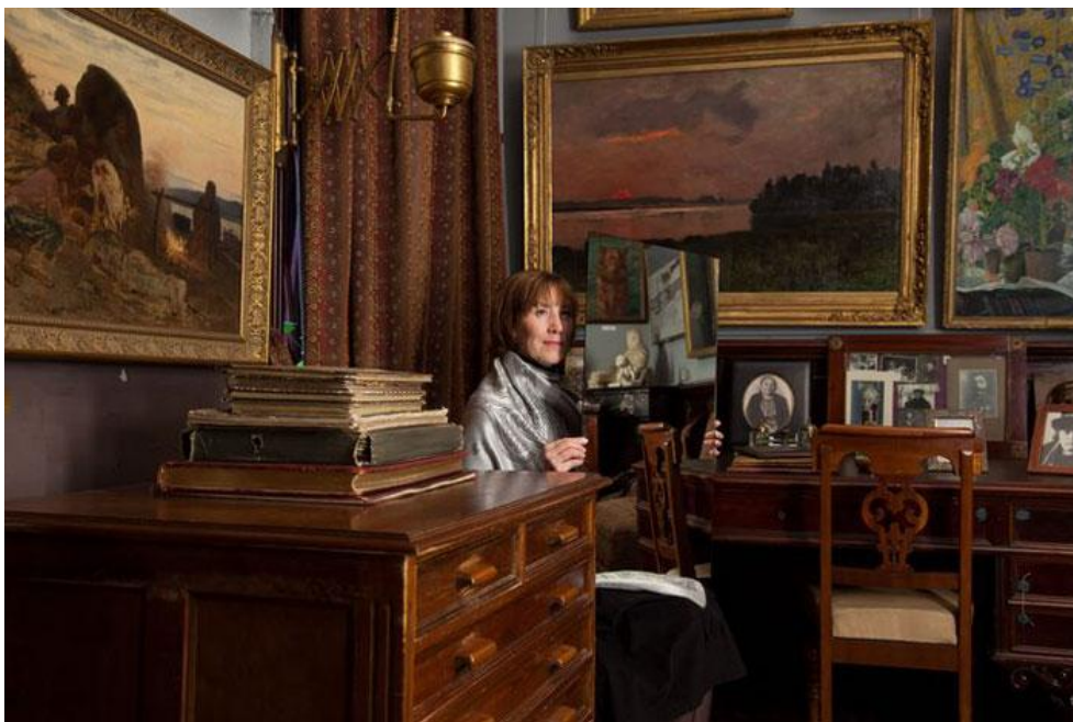
Работа Адад Ханны

работу. Но на этот раз канадский художник создал при участии музейщиков лирический проект. В отличие от модернистских пространств больших музейных залов комнаты, в которых жил классик советской живописи, тесно заполнены и картинами, и предметами быта. В отражении в зеркалах эта теснота заметна в удвоенном масштабе, появляется свойственная видео цифровая плоскостность и яркость красок. Благодаря игре с зеркалами художник смог добиться от впервые увиденных им людей небанального образа, отличающегося от ставших общим местом портретов музейных зрителей.