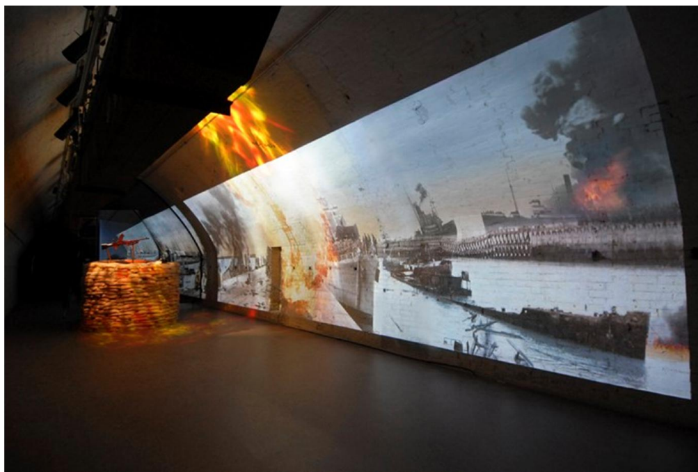
«Секретный туннель времен II Мировой Войны» в Дуврском замке

И в Дуврском замке, и в музее Холодной войны, я пытаюсь рассказывать о людях, которые жили или работали в этих местах в определенный период времени. Это личные истории, и они идут у меня скорее от сердца, чем от головы. Мы работаем со светом и с видео в данном случае для того, чтобы заставить сердца посетителей биться чаще, чтобы люди почувствовали атмосферу другого времени.